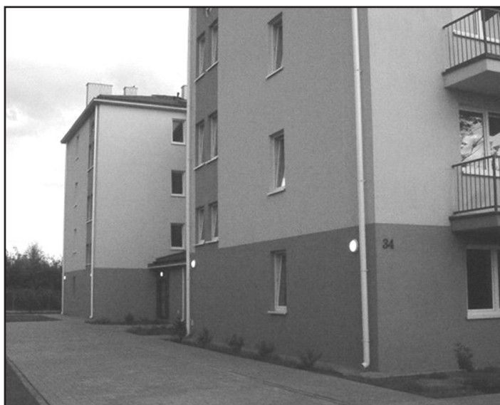
zdj. Inwestycja przy ul. Naukowej 34

Jeszcze jedno. W tej części Włoch, gdzie przewidziana jest dobrze zaprojektowana nowa zabudowa wielorodzinna, i gdzie działka należąca do miasta ma 17 ha, - mowa o Polach Karolińskich - rada dzielnicy Włochy nie przewidziała w wieloletnim planie inwestycyjnym budowy domów komunalnych. Szkoda, bo